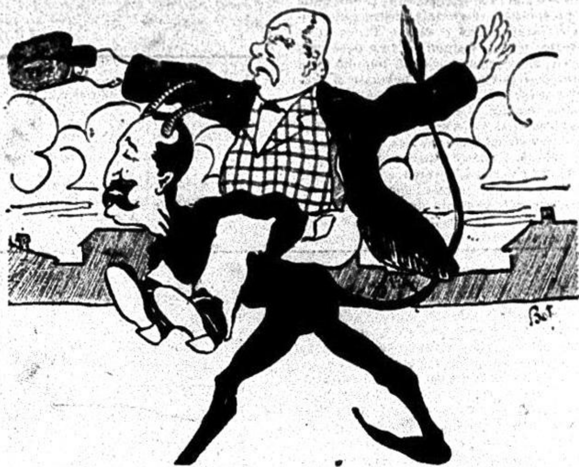
Belzebut: Din toți, ăsta o să mă deșele!